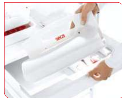
La colchoneta graduada enrollable se puede guardar en espacios reducidos.

La superficie es muy fácil de cuidar y también muy robusta, ya que este material se puede limpiar con todos los desinfectantes de uso comercial.